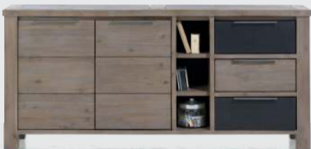
art. nr. 33791* Dressoir 2-deuren + 3-laden + 3-niches bxhxd 180x82x42 cm