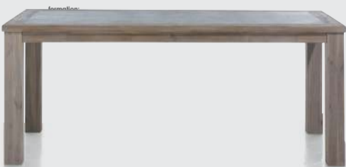
art. nr. 33801 Eetkamertafel bxhxd 190x77x100 cm