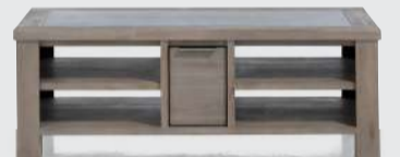
art. nr. 33797 Salontafel 1-lade T&T + 4 niches bxhxd 60x45x125 cm