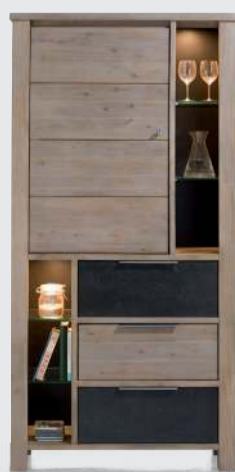
art. nr. 33795* Bergkast 1-deur + 3-laden + 6-niches (+ LED) bxhxd 100x200x42 cm