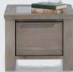
art. nr. 33798 Hoektafel 1-lade T&T bxhxd 55x45x55 cm