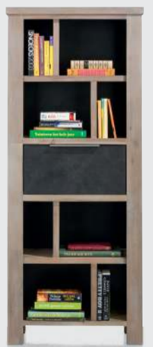
art. nr. 33799* Boekenkast 1-lade + 8-niches bxhxd 70x170x35 cm

* keerbare lades, weathered grey kleur of vulcano antraciet