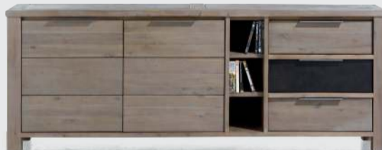
art. nr. 33792* Dressoir 2-deuren + 3-laden + 3-niches bxhxd 220x82x42 cm