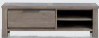
art. nr. 33793 TV-Dressoir 1-klep + 2-niches bxhxd 140x45x42 cm