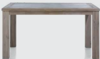
art. nr. 33800 Eetkamertafel bxhxd 150x77x90 cm