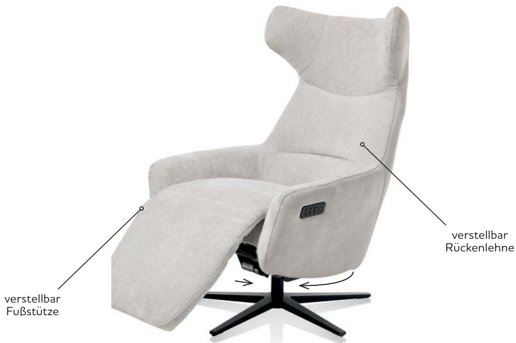
Sessel Art. Nr.: 49180 Nackenkissen Art. Nr.: 49181