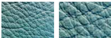
Cuir lisse pigmenté : les pores sont à peine visibles, une épaisse couche pigmentée est appliquée sur ce cuir