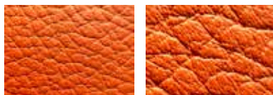
Cuir semi-aniline : les pores des poils sont clairement visibles, mais ce cuir est doté d'une fine couche pigmentée