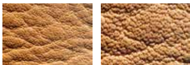
Cuir pure aniline : les pores des poils sont clairement visibles, aucune couche de coloration n'est appliquée sur ce cuir

Ce type de cuir est doté d'une couche de finition pigmentée couvrante, qui rend invisibles ou presque les inégalités naturelles. La couche appliquée sur ce cuir offre une protection supplémentaire contre les influences extérieures (par exemple, la lumière du soleil). Le kit Leather care set est la meilleure manière de nettoyer et d'entretenir votre cuir pigmenté. Renseignez-vous auprès de votre magasin d'ameublement quant aux caractéristiques et à l'utilisation de ces produits.