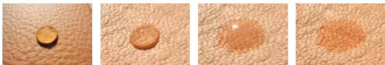
L'illustration 1 montre une goutte d'eau sur une peau de vache pigmentée. L'eau ne pénètre pas dans le cuir. Les illustrations 2 à 4 montrent la même expérience, avec un cuir à pores ouverts (cuir aniline ou semi-aniline).