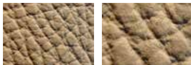
Cuir lisse pigmenté : ses pores ne sont plus reconnaissables, une épaisse couche pigmentée est appliquée sur ce cuir